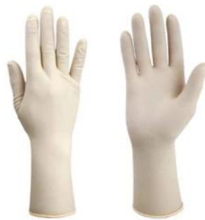
Fig.1: Guante quirúrgico estéril sin polvo (par) (no incluye diseño)