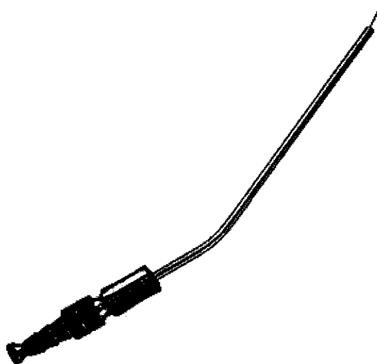
Fig.1: Cánula de aspiración de frazier (no incluye diseño)