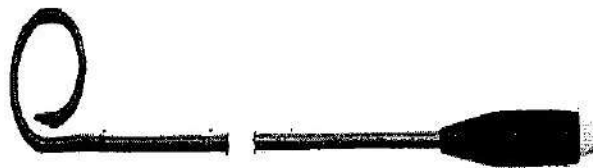
Fig. 1: Catéter de drenaje percutáneo (no incluye diseño)