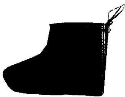
Fig.1: Botas descartables (no incluye diseño)